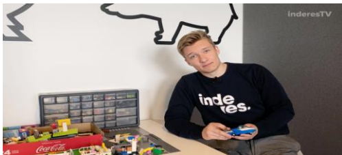
Mikä on Inderesin laaja raportti?