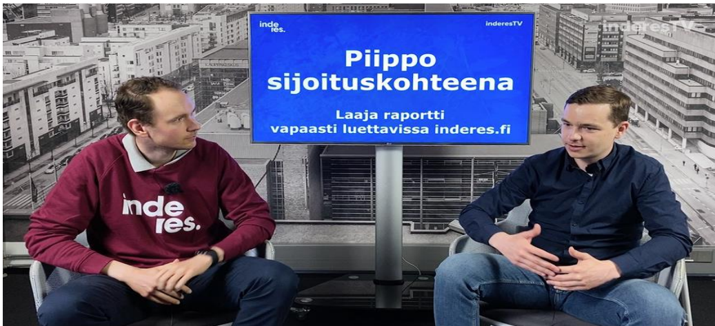
Piippo: Askelmerkit käänteeseen