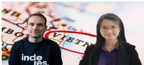
Poikkeuksellinen vuosi | Salkunhoitajat – PYN Elite