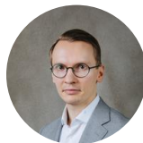
2020 Olli Koponen