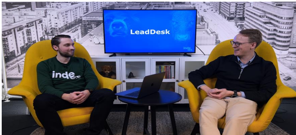
LeadDesk: Potentiaalia piisaa haasteiden väistyessä